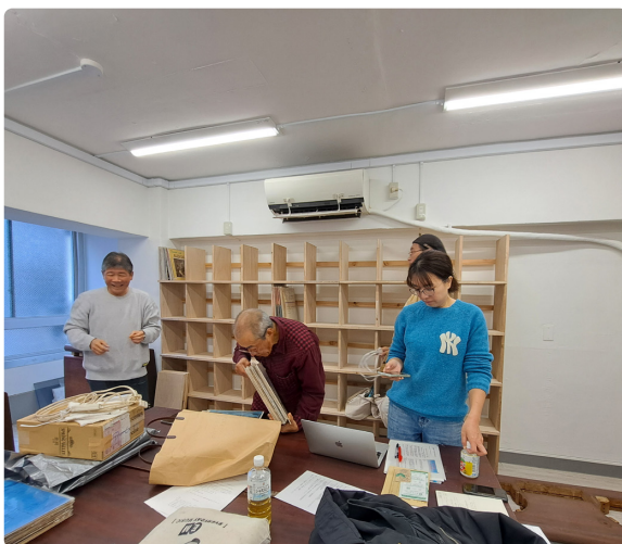
The before and after shots of MCY’s listening room

MCY is now the steward of Jazz Cafe Chigusa’s valuable record collection and audio equipment while the café is closed. The organization maintains and preserves these materials and has opened a listening room where people can continue to enjoy the music. In addition, MCY plans and operates music performances and art events, helping to keep Chigusa’s cultural legacy active and